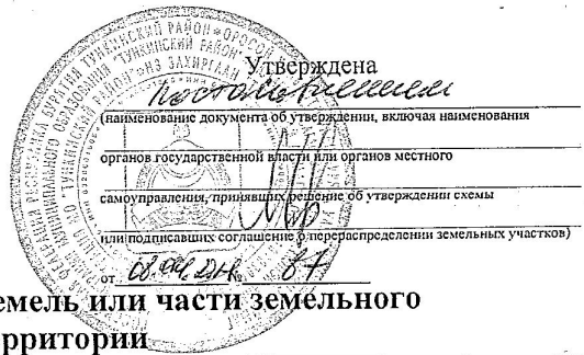
Схема границ предполагаемых к использованию земель или части земельного участка на кадастровом плане территории

Условный номер земельного участка: 03:20:720101:112:ЗУ1