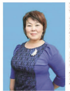
Коллектив Горнокой школы

Приятно знать, что рядом есть грамотный координатор, специалист своего дела и чуткий человек — наш директор, который очень уважает весь коллектив. Она — директор по призванию, легко общается и находит общий язык со всеми людьми, решает самые сложные вопросы. Мы гордимся нашим директором, нам нравится работать под её руководством. Она — капитан, ведущий корабль нашей школы ровным курсом, несмотря на штормы и